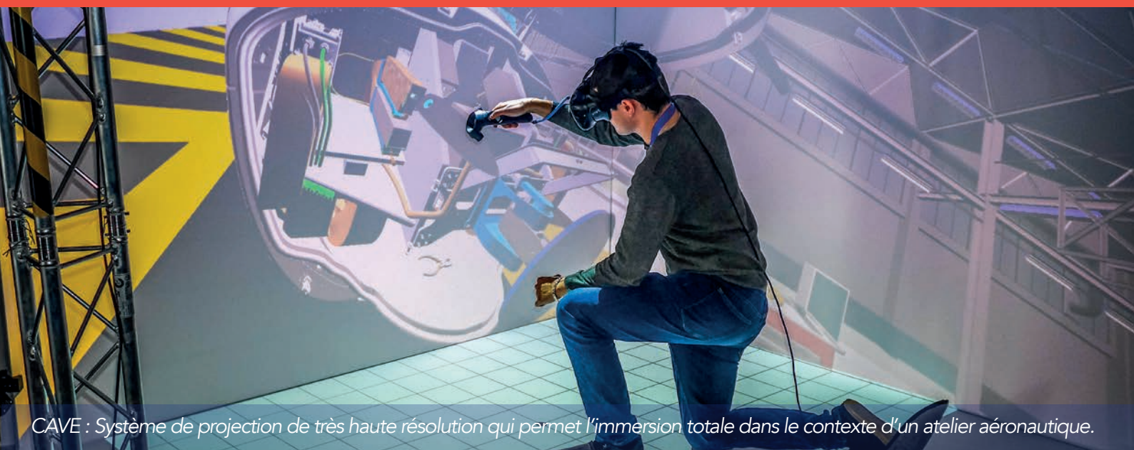
CAVE : Système de projection de très haute résolution qui permet l'immersion totale dans le contexte d'un atelier aéronautique.